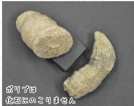
ポリプは化石にはなりません