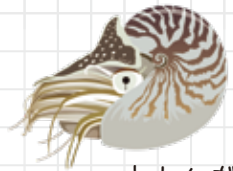
オウムガイ よりも、